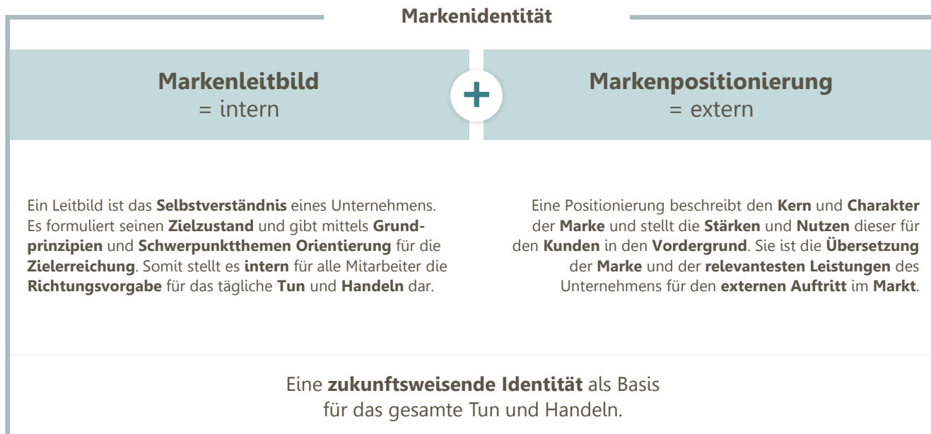
Abb. 2: Bestandteile der Markenidentität